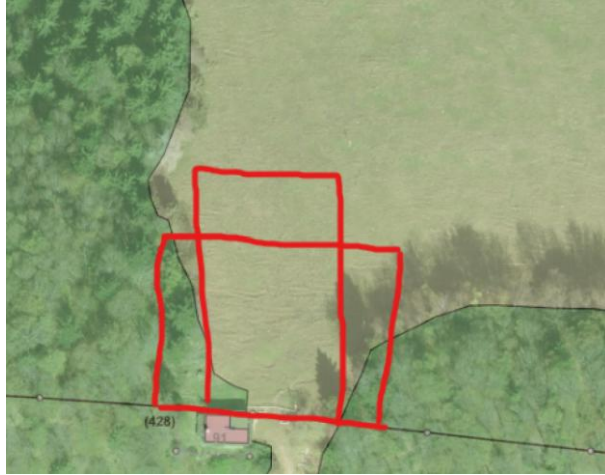
Startfeld 30 x 50 m

Beat zeigt ein paar erklärende Bilder dazu: